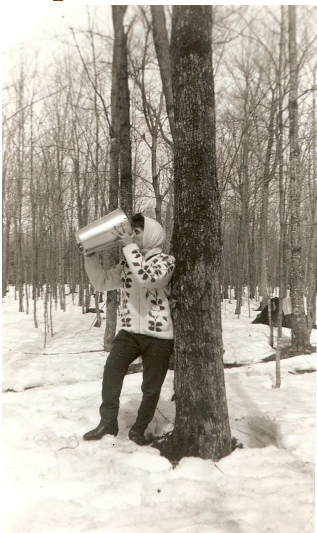
La dégustation de l'eau d'érable